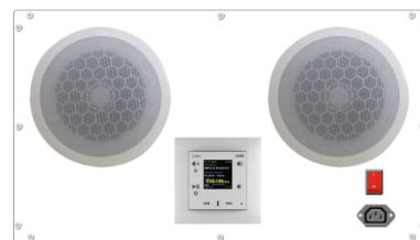
Panel UV-141, INELS LARA rádio, demonstrační panel Internetové rádio a audiosystém v chytré domácnosti.